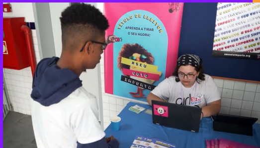
Grupos de Jovens se mobilizam para incentivar adolescentes de 16 e 17 anos a tirarem o título de eleitor