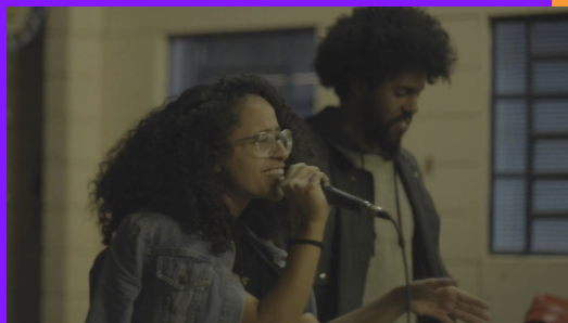
Midria - Slam USPerifa (SP)